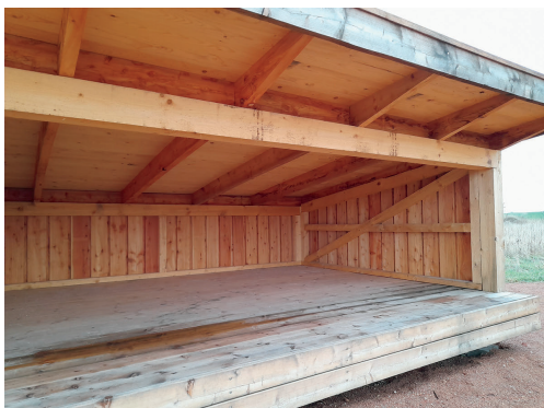
Eksempel på billede af shelterens åbning.