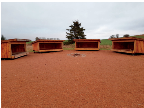
Eksempel på billede af pladsen foran shelteren og området som helhed.