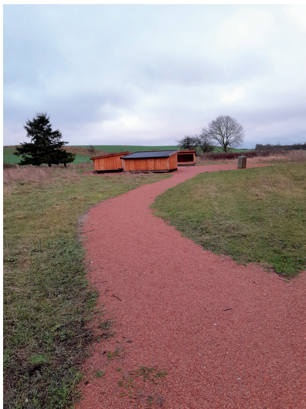
Eksempel på billede af adgangsvejen fra hovedruten, hvor man også kan se sidevejens overflade.